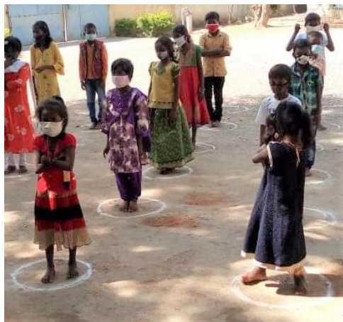
Ci-dessus avril, ci-contre, la même cour en septembre