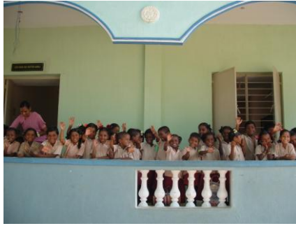
Good bye – See you next!!! A la prochaine !!!