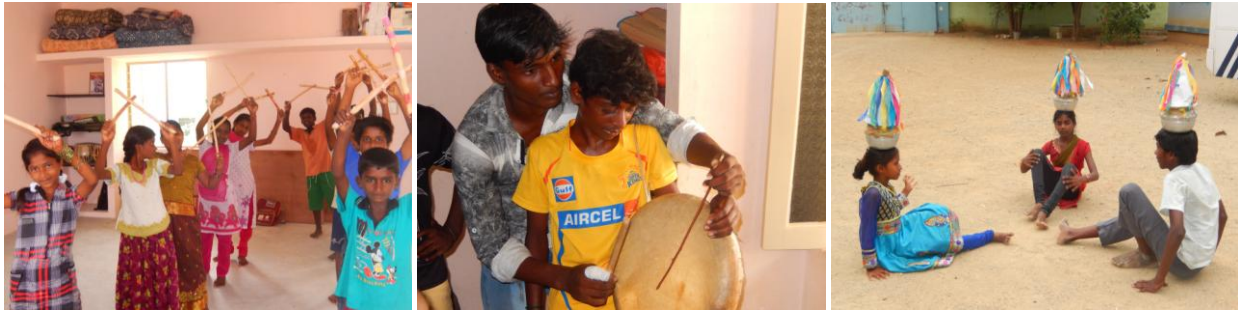
Cours de danse, musique, théâtre, poésie, dessin, yoga du 15 au 19 mai pour le plus grand plaisir des 45 enfants.