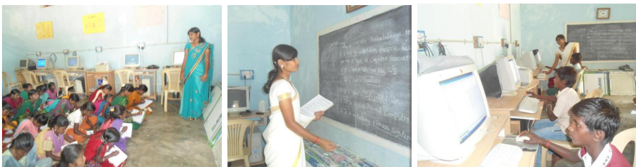
Cours d'informatique de différents niveaux en fonction de l'arrivée des enfants et des jeunes.