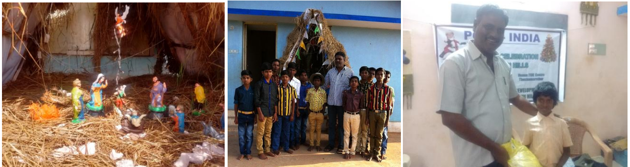
Noël dans les tribus de Jawadhu Hills