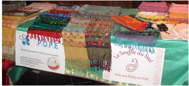
L'UDV et les étoles indiennes chatoyantes au Forum Social organisé à Lambersart.