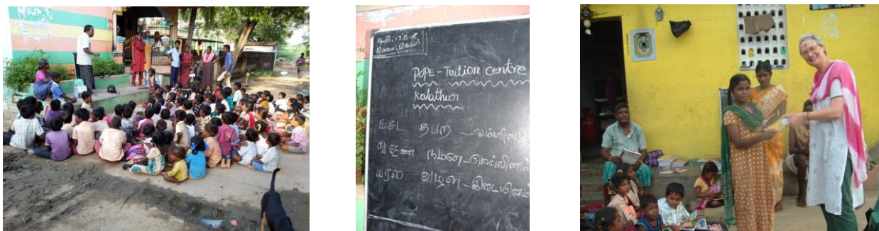
Août 2015 – Cécile rend visite aux écoliers qui se réunissent après l'école pour faire leurs devoirs.