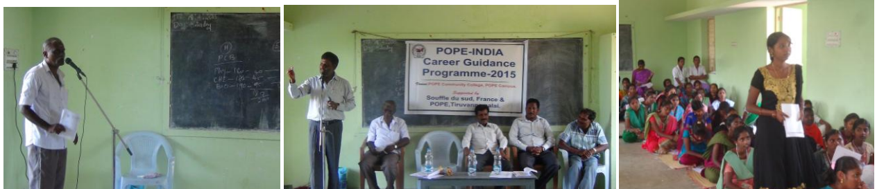
Le stage d'orientation professionnelle s'est déroulé du 18 au 19 avril, 97 jeunes en ont bénéficié.