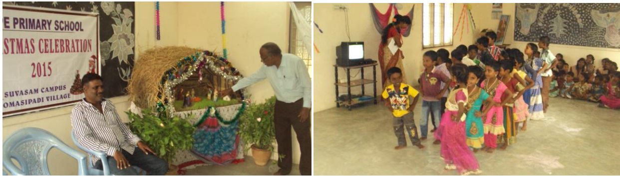
Noël à Suvasam