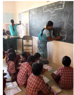
Un chauffeur amène les élèves au centre Suvasam et les ramène le soir chez eux – Classe de CP – Cours de sciences pour les CM1 et CM2.