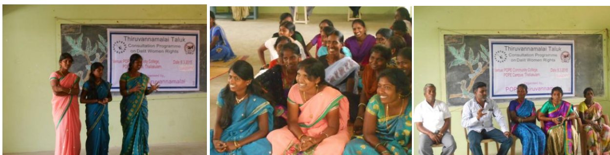
8 mars 2015 - Journée internationale de la Femme. De très bons échanges, ces femmes sont résolues à travailler pour leurs droits et privilèges.

Ces femmes seront un modèle pour les futures générations et nous espérons qu'elles inspireront le respect de tous les membres de la communauté.