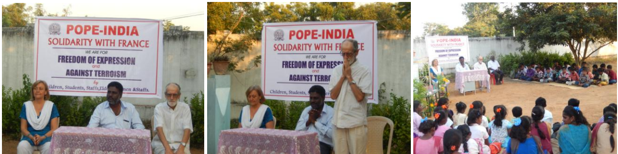
Le 10 janvier 2015 - POPE exprime sa solidarité avec la France juste après les attentats survenus à Paris.

2015 fut une année de bouleversements et de drames dans beaucoup de pays, dont la France, durement frappée par le terrorisme. Nous avons été tous très affectés mais nous devons rester solidaires.