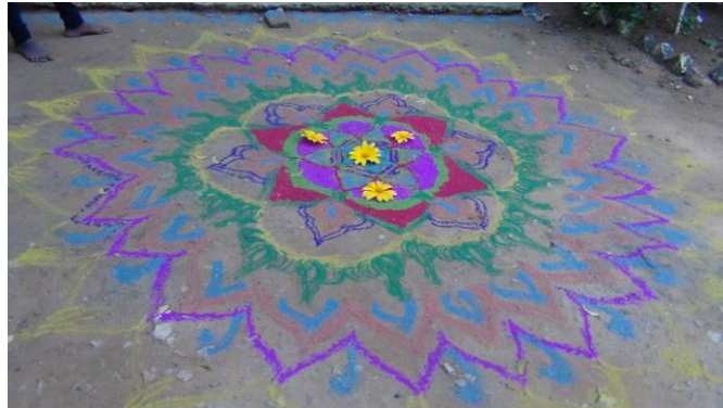
Kolam dessiné pour la célébration de Noël à Thallakulam