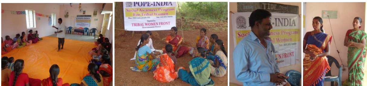
24 janvier 2015 - Conscientisation des femmes tribales sur leurs droits et devoirs.