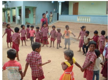
Jeux d'équipe dans la cour.