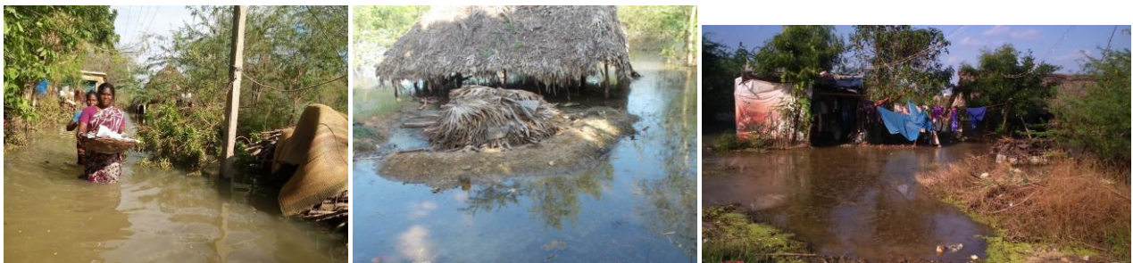
Le 11 novembre 2015 - C'est le pire déluge qu'ait connu la région en un siècle, des pluies incessantes pendant 2 mois. Les pauvres gens ont tout perdu.

Cette fin d'année fut terrible pour le sud de l'Inde et le Tamil Nadu, la région de POPE, en raison d'inondations catastrophiques (dont les médias ont très peu parlé). Ces inondations ont endommagé des régions, des villes dont Cuddalore et Chennai (ex Madras) la 4 e plus grande agglomération indienne et détruit de nombreux villages, isolant la population en majorité dalite et tribale. Il y a eu de nombreux morts et les besoins sont énormes, les familles ayant tout perdu (biens, huttes ou maisons, bétail) et elles sont laissées sans ressources. L'aide du gouvernement indien est bien faible par rapport aux besoins ou inexistante pour beaucoup de dalits. Un scénario déjà vécu lors du tsunami de décembre 2004.