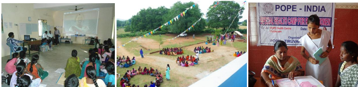
Formation des leaders – Grande réunion d'information et de travail – Sensibilisation à la santé reproductive.