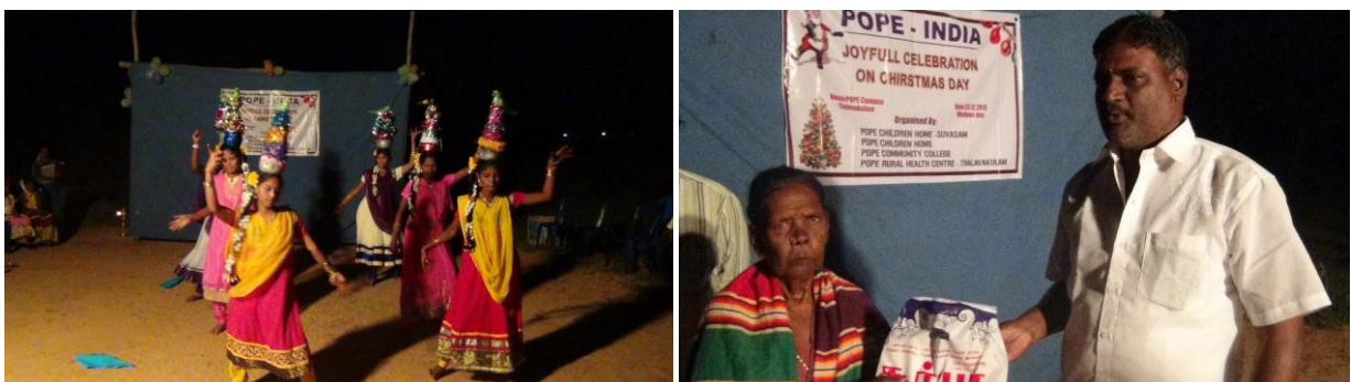
Noël à Thallakulam avec les jeunes et les séniors.