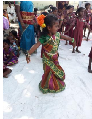
15 août 2015 : fête nationale qui commémore le jour de l'indépendance de 1947.