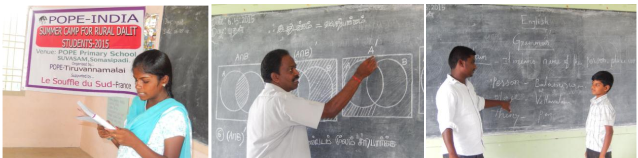
Le stage de cours intensifs pour affronter l'examen public en classe de 2 nd e. 30 élèves sont venus à Thallakulam du 2 au 17 mai pendant les vacances scolaires et la période la plus chaude.